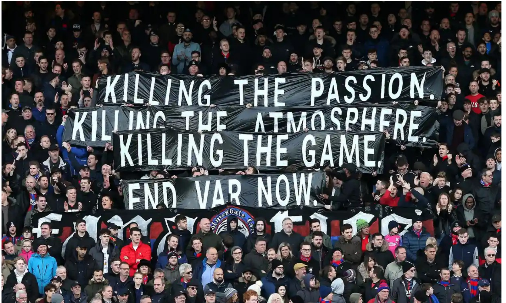
The Guardian, Crystal Palace fans, 2022

'Let the ref decide, not somewhere in Heathrow'