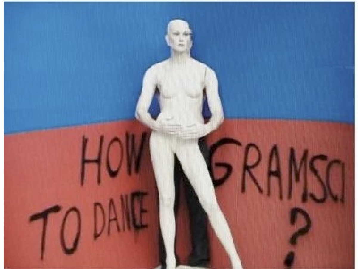
Thomas Hirschhorn, Dancing Philosophy , 2012