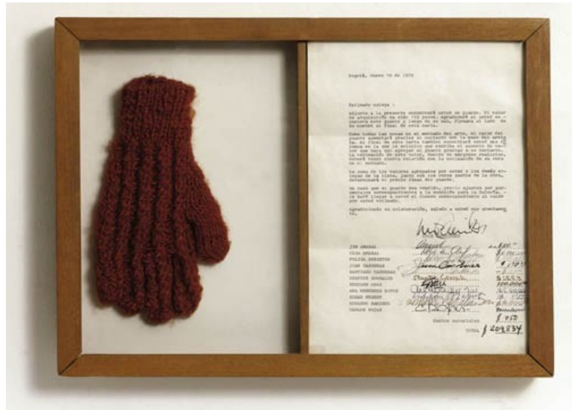
Luis Camnitzer, Plusvalía , 1979