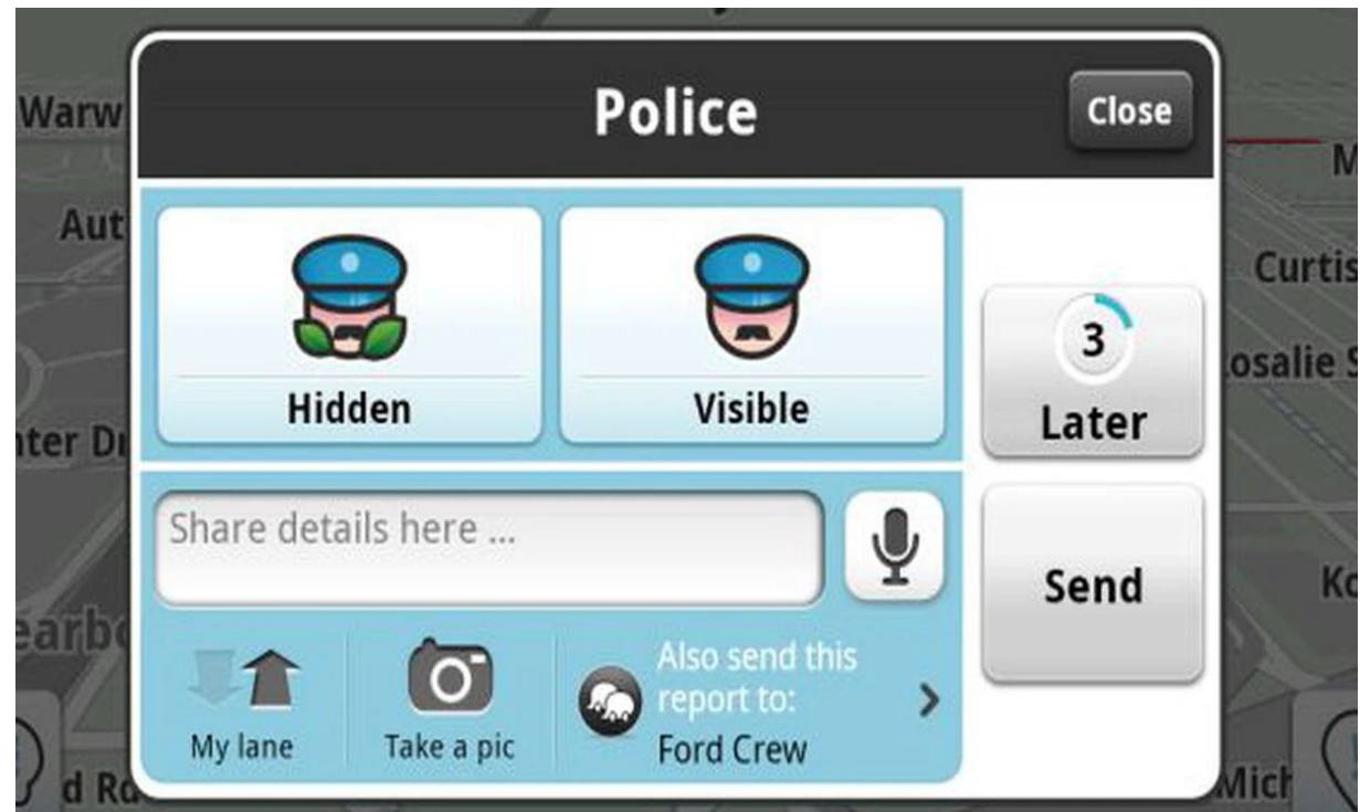
Waze (captura de pantalla), 2022

¿Cómo modificamos las condiciones de los entornos y las tecnologías en los que estamos incluidos?