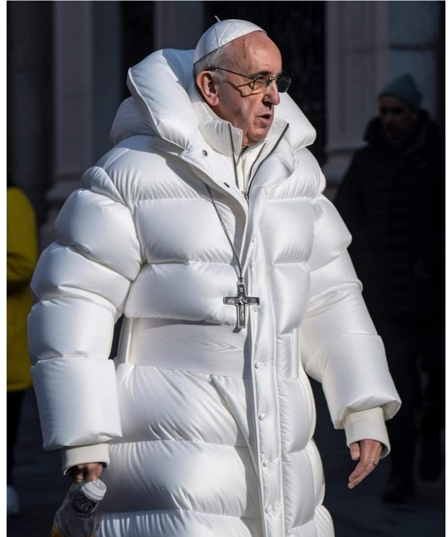
Pablo Xavier, Papa Francisco con Balenciaga , 2023

Las universidades están discutiendo si es aceptable el sistema de evaluación de talla única para todas las disciplinas, pero el debate no ha llegado a si se trata de una prenda única o si solamente es un tema de talla.